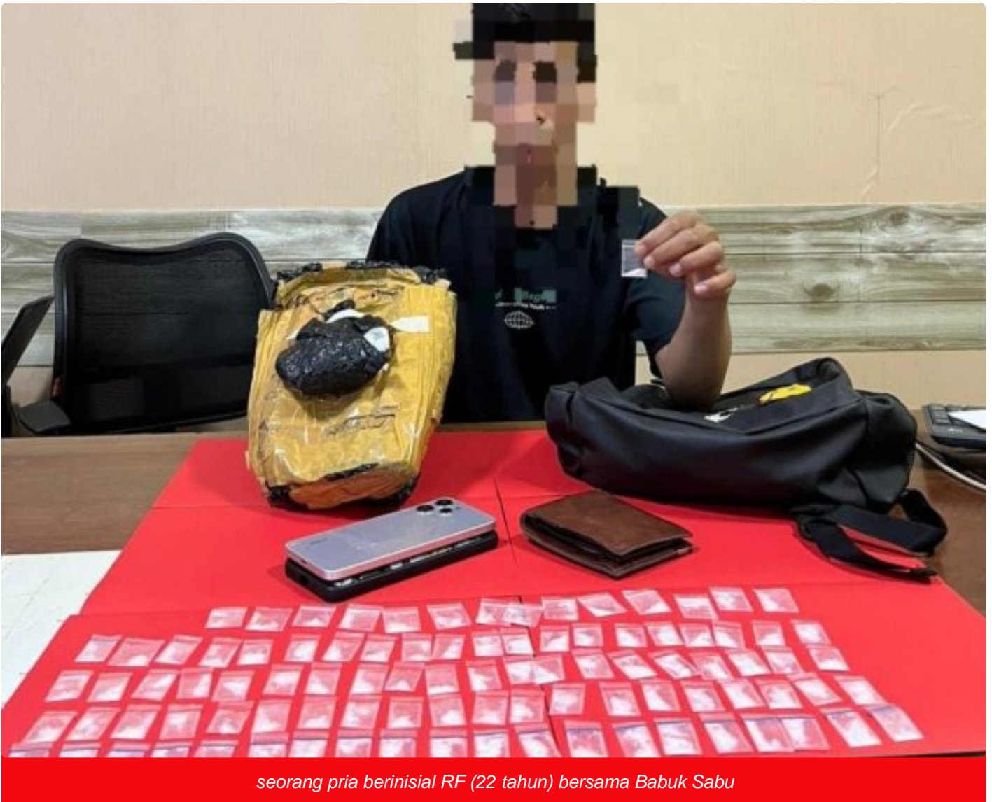
seorang pria berinisial RF (22 tahun) bersama Babuk Sabu

MOROWALI, Sulawesi Tengah- Personel Satuan Reserse Narkoba (Satresnarkoba) Polres Morowali kembali menunjukkan komitmennya dalam